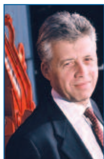
Gérard Déprez, Président de Loxam

Le Capital Investissement est une solution appropriée dans l'atteinte d'un tel objectif. Plus qu'un simple apporteur de capitaux, l'investisseur en capital participe à la définition du plan de développement de l'entreprise, apporte son expérience et son réseau de compétences et renforce la crédibilité de l'entreprise vis-à-vis des tiers. A l'appui d'une réflexion commune et d'un consensus accepté et partagé par l'ensemble des parties, l'investisseur se positionne comme un véritable partenaire, il accompagne le management lors des décisions stratégiques, il lui transmet sa culture du résultat et participe à la création de valeur à moyen et long terme au sein de l'entreprise.